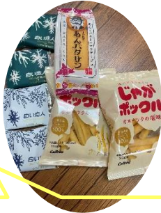
北海道からのお土産